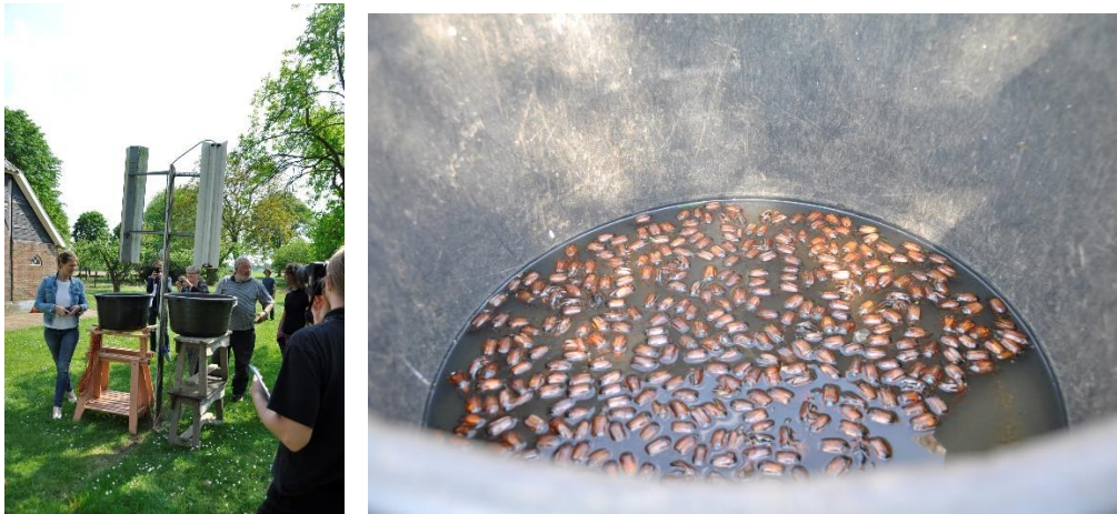
Figuur 26 & 27 Links: Eigenhandig gebouwde lichtval voor het wegvangen van meikevers als natuurlijke bestrijdingsvorm. Rechts: Bak met zeepoplossing waar meikevers in terecht komen en verdrinken.

water en afwasproduct waardoor ze onmiddellijk verdrinken. Ook bestrijding met aaltjes is mogelijk maar dan moet dit vroeg in de cyclus gebeuren. Harm heeft hiermee nog geen ervaring.