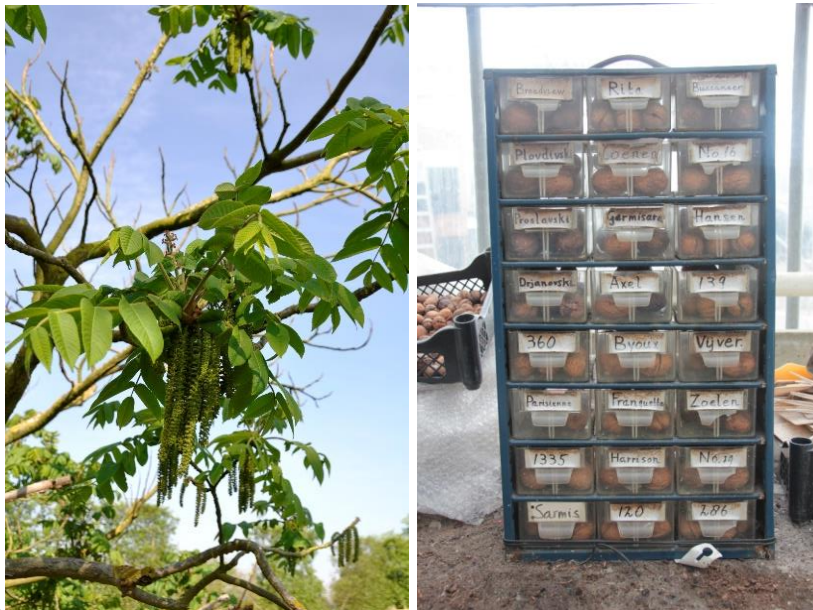
Figuur 7 en 8 Links: Japanse walnoot met typische trosvormige bloemen. Rechts: Verzameling walnoten van een reeks belangrijke variëteiten.

De Germisara, een Roemeens ras, produceert noten die omwille van het hoge oliegehalte (60%) zeer geschikt zijn voor het persen van walnotenolie. In de botanische tuin staan ook andere soorten zoals de Japanse walnoot ( Juglans ailanthifolia ). Dit zou een hele lekkere noot zijn, maar met een enorm harde schaal. De boom is makkelijk te herkennen aan de typisch lange trossen bloemen.