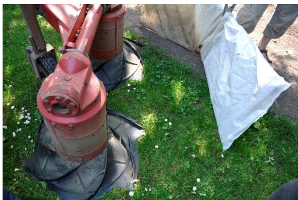
Figuur 29 Zelf ontwikkelde machine waarmee de noten door twee ronddraaiende rubberen vegers in een rij op de zwartstrook worden verzameld.

Op de zwartstrook worden alle bladeren weggeblazen en rollen de noten naar één kant van de zwartstrook waar ze nadien kunnen opgeschept worden. Je zou ze ook kunnen opzuigen zegt Harm, maar dat zorgt ervoor dat je meer zand en aarde hebt in de noten. Eén van zijn collega's was van plan de bomen te schudden en zo de noten op te vangen. Ook dit bleek geen goede methode omdat de noten met jurkje en al afvielen en nadien meer inspanning nodig was om ze te schonen. Per persoon kan er 400 à 500 kg noten per dag geoogst worden. In het totaal is Harm ongeveer 10 à 12 dagen bezig met oogsten.