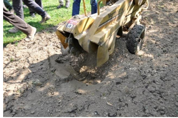
Figuur 14 & 15 De stobben werden verwijderd met een stobbenfrees zodat de stook over gans de breedte makkelijk te maaien en te onderhouden is.

Door de middelste rij telkens weg te nemen, was er initieel een terugval in opbrengst, om nadien terug een gelijke opbrengst/ha te bekomen, vermits er meer licht en lucht voor de bomen was. De zwartstroken onder de bomen zijn erg handig om makkelijk te kunnen bemesten en zijn eveneens erg praktisch om de noten te oogsten. In het voorjaar wordt de boomgaard bemest met biologische rundveedrijfmest (140 kg N/ha) omdat deze een goede N:P:K-verhouding heeft. Varkensdrijfmest bevat teveel fosfaat in verhouding tot stikstof. Het is belangrijk de stikstofgift te beperken, want anders gaan de bomen te fel groeien en krijg je teveel snoeiwerk. De bemesting gebeurt vrij laat (begin mei) want de stikstof is maar zinvol éénmaal de noten echt beginnen te groeien. De zwartstroken worden in het voorjaar geschoffeld om ze onkruidvrij te houden.