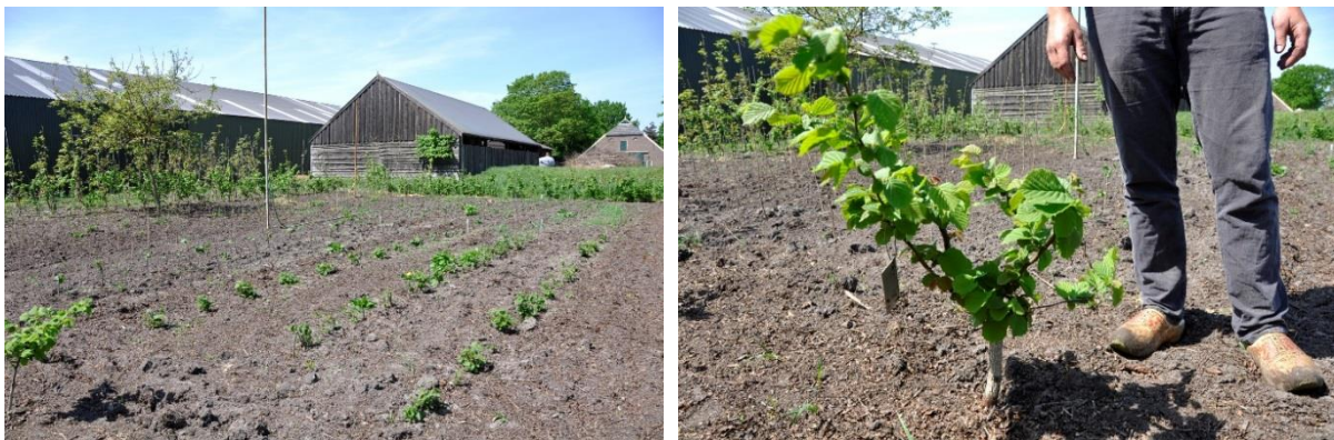
Figuur 43 en 44 Links: Plantbed voor de opkweek van eigen plantgoed. Rechts: Een hazelaar geënt op de wortel van Turkse hazelaar.

Op het bedrijf wordt heel wat plantgoed zelf opgekweekt. Roderik trachtte het enten zelf wat in de vingers te krijgen en ent ondertussen 100 à 200 notenbomen en een 400 à 500 hazelaars per jaar. De onderstammen voor de notelaars koopt hij aan, maar het griffelhout produceert hij zelf. Volgens Roderik is het moeilijkste bij het enten van walnoten, het voorkomen van uitdrogen. Het beste is te enten wanneer de bomen in rust zijn (op een winterdag) en het geheim om succes te oogsten is na enten de entplaats gedurende 3 weken te verwarmen op een temperatuur tussen 26 en 28°C. Dit gebeurt door ze op de hot tube te leggen. Na het enten worden ze eerst opgekweekt op het plantbed in erg dicht plantverband. Na 2 jaar worden ze dan uitgeplant op een plantafstand van 1 m x 1m. Na 6 à 7 jaar worden ze dan definitief uitgeplant in de weides.