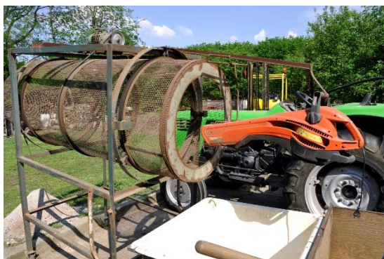
Figuur 30 Met behulp van deze simpele opstelling van een cilindervormige zeef, bladblazer en een bak met water worden de noten gereinigd.

Op de zwartstrook worden alle bladeren weggeblazen en rollen de noten naar één kant van de zwartstrook waar ze nadien kunnen opgeschept worden. Je zou ze ook kunnen opzuigen zegt Harm, maar dat zorgt ervoor dat je meer zand en aarde hebt in de noten. Eén van zijn collega's was van plan de bomen te schudden en zo de noten op te vangen. Ook dit bleek geen goede methode omdat de noten met jurkje en al afvielen en nadien meer inspanning nodig was om ze te schonen. Per persoon kan er 400 à 500 kg noten per dag geoogst worden. In het totaal is Harm ongeveer 10 à 12 dagen bezig met oogsten.