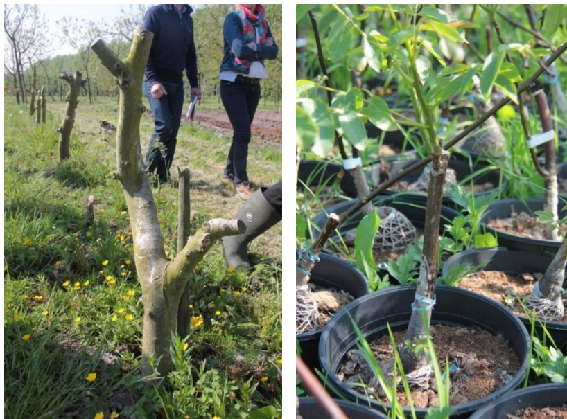
Figuur 3 & 4 Links: Moederbomen voor de productie van enthout. Rechts: geënte notelaar met een onderstam van Juglans regia .

gehouden om het aangroeien te stimuleren. Tijdens deze periode worden de planten ook vochtig gehouden en worden ze volledig afgedekt om luchtcirculatie tegen te gaan. Cruciaal is het vermijden van uitdrogen en infectie door Xanthomonas juglandis (bacteriebrand). Daarna worden ze in een pot eerst in een serre en dan buiten opgekweekt. Na twee jaar in de pot halen ze makkelijk 1,5 à 2 m. Op die grootte worden ze uitgeplant op het veld om na nog eens twee à vier jaar, afhankelijk van de wensen van de koper, verkocht te worden. Vooral op jonge leeftijd wordt er gespoten met koper om bacterievuur en schimmels te vermijden. Jaarlijks enten Peter en zijn collega's een 8.000 à 10.000 stuks notelaars. Ze halen hierbij een slaagpercentage van 80% tot 99%.