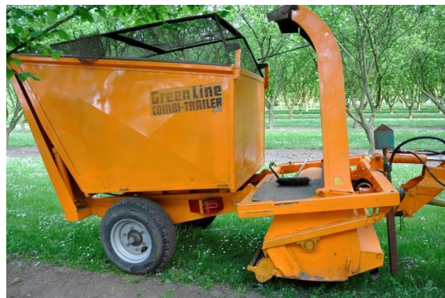
Figuur 20 De klepelwagen wordt gebruikt om takken, snoeimateriaal en oogstresten op te rapen en te klepelen waarna ze kunnen gecomposteerd worden samen met het maaisel van de grasstroken.

De bladeren die opgeruimd worden en het versnipperde snoeihout worden samen met gekraakte notenschalen gecomposteerd (regelmatig omzetten en vochtig houden is noodzakelijk). Hiervoor wordt onderstaande klepelwagen met opvangkar gebruikt. Dit materiaal wordt verzameld en gebruikt voor compostering. Na 2 à 3 jaren heb je een goed product, dat volledig verteerd is.