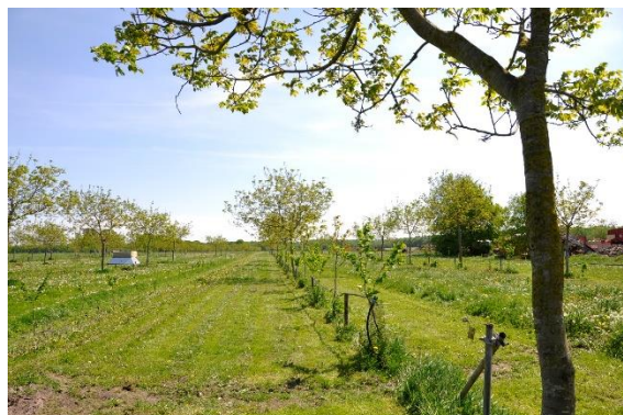
Figuur 40 De grootste bomen zijn nu 15 jaar oud en staan 9 jaar aangeplant in het weiland.

Gedetailleerde info over alle rassen vind je via onderstaande link: http://www.notengaardbisschop.nl/noten/