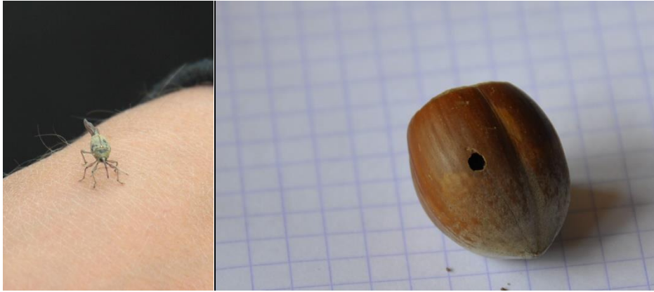
Figuur 21 & 22 Links: Adulte hazelnootboorder. Rechts: Hazelnoot die aangevreten werd door de hazelnootboorder.

De larve boort zich later door de verhoude wand naar buiten, waardoor de gaatjes in de noten ontstaan. In het totaal is er ongeveer 5% uitval door gaatjes in de noten. Bij de wilde hazelaar is dit percentage veel groter. Dit komt omdat het vruchtbeginsel van de wilde hazelaar makkelijker doordringbaar is. Harm maakte de afspraak met de koper van de noten dat 2% van de noten een gaatje mag bevatten. Daarom moet hij zijn noten wel schonen en het grootste deel van de aangetaste noten scheiden van de rest. Dit doet hij met behulp van een ventilator die de noten op basis van hun gewicht selecteert (zie onderstaande afbeelding).