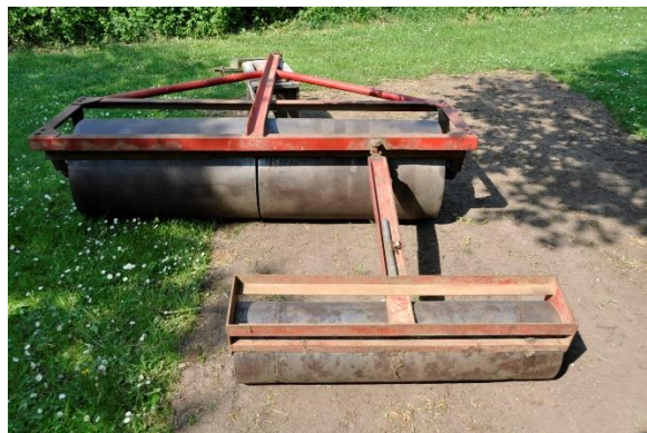
Figuur 28 Systeem met dubbele rol om zwartstroken goed te effenen vooraleer de start van het oogstseizoen.

Voor de oogst is het belangrijk dat de grond zo schoon en vlak mogelijk is. Daarom is het belangrijk om nooit in de boomgaard te gaan met machines als het te nat is. Spoorvorming tussen de bomenrijen kan namelijk de machinale oogst nadien enorm bemoeilijken. In de maand juli worden de zwartstroken ook vlak gerold