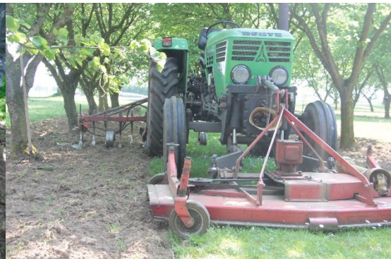
Figuur 16 & 17 Met de aangepaste schoffelmachine van Harm is het mogelijk om telkens de helft van de zwartstroken te schoffelen. Dankzij het extra mes op de zijkant (blauwe cirkel) wordt ook de strook tussen de bomen meegenomen. Bij een boom klapt het mes automatisch in waardoor de bomen niet beschadigd worden.