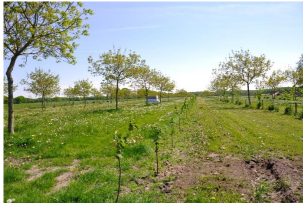
Figuur 41 De aanplant van de eerste hazelnoten gebeurde door op 6m afstand een nieuwe rij aan te planten tussen de bestaande rijen walnoten. De onderlinge afstand in de rij bedroeg hierbij 3,5 m.

notelaars zou bevorderen en anderzijds de productie aan noten op korte termijn zou verhogen. In totaal werden nu al een 1000-tal hazelaars aangeplant.