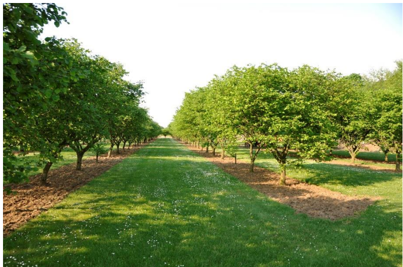
Figuur 11 & 12 Links: Harm Tuenter weet zijn passie voor hazelaars en energie over te brengen bij de deelnemers tijdens het bedrijfsbezoek. Rechts: Beeld van hoe de plantage er ondertussen na 25 jaar uit ziet.

Harm kreeg de liefde voor bomen mee van zijn vader en leerde ook snoeien van hem. Dankzij het artikel raakte hij ook geïnteresseerd in hazelnoten. Samen met 13 anderen sloot hij zich dan ook aan bij een studieclub omtrent notenteelt; hij raadt aan om nooit met noten te starten zonder je erin samen met anderen te verdiepen. Harm startte begin jaren '90 samen met zes anderen met de teelt van hazelnoten wat uitmondde in de oprichting van de coöperatie EKOnoot in 1991. Hij teelt biologisch want de prijs van bio-noten is dubbel zo hoog als de prijs van gewone noten. Harm had eerst zijn twijfels of het biologisch telen niet te arbeidsintensief zou zijn in combinatie met zijn voltijdse job maar is nu ondertussen overtuigd bio-teler. Hij gebruikt geen chemische middelen voor het bestrijden van plagen en onkruid, en gebruikt geen kunstmest.