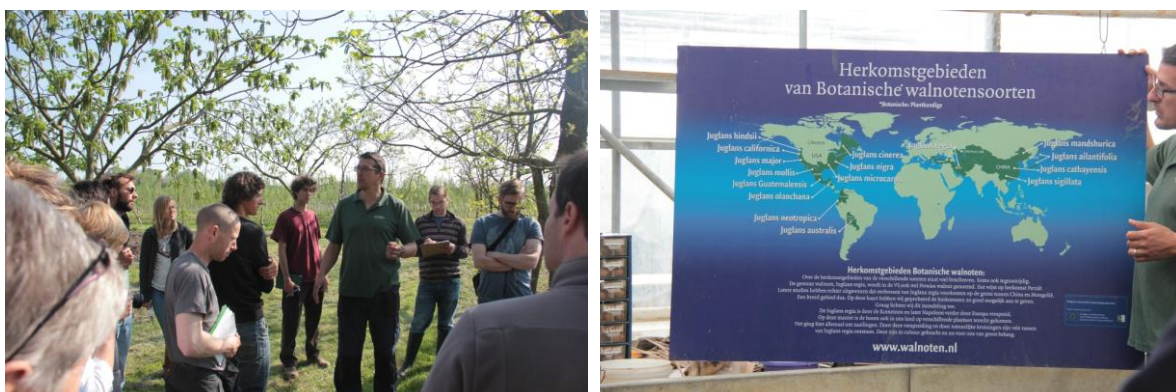
Figuur 5 & 6 Links: Bij de gebouwen van de kwekerij staan enkele bomen van een tiental jaar oud, om te tonen aan de kopers wat ze mogen verwachten. Rechts: Herkomstgebieden van botanische walnotensoorten.

In de botanische tuin en rond de bedrijfsgebouwen van de kwekerij, waar een 65 tal notenrassen en -soorten bijeen staat, maakten we kennis met gevestigde waarden en enkele opmerkelijke variëteiten. De Broadview, een variëteit waarvan de moederboom in British Colombia (Canada) staat maar met vermoedelijke herkomst in de Karpaten, springt er volgens Peter bovenuit en is dé gevestigde waarde. De boom is makkelijk te enten, weinig ziektegevoelig, produceert vroeg en veel noten, is een zelfbestuiver, wordt maar 8 à 10 m breed (en past dus in de meeste tuinen), bloeit laat en heeft dus niet veel last van vorstschade, kortom de ideale notelaar. Voor wie het nog kleiner wil, is er de Westhof's Dwarf, een variëteit die bij toeval ontdekt werd op de kwekerij. Deze boom wordt maar 2,5 m groot.