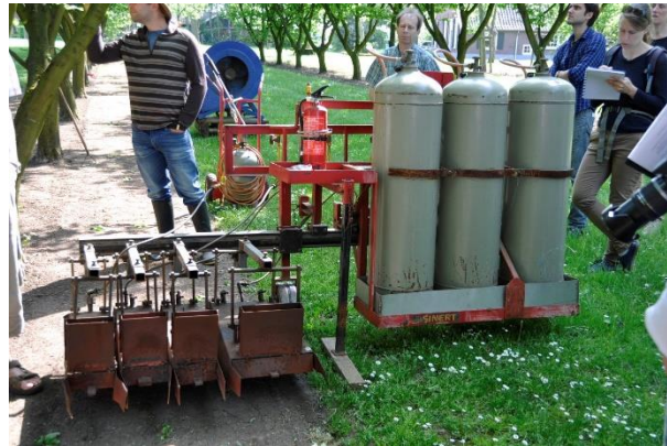
Figuur 19 Eigen ontwikkelde onkruidbrander gebruikt om de zwartstroken onkruidvrij te houden tijdens de zomer.

Vanaf juli worden de stroken schoon gebrand (2 x/jaar) in plaats van geschoffeld, door middel van een handbrander. Schoffelen gaat dan minder goed want juli is meestal een vochtige en groeizame maand. Met het branden wordt vooral het heel jonge onkruid vernietigd, meerjarige onkruiden zijn hiermee niet weg te krijgen. Het branden gebeurt bij voorkeur bij vochtig weer want dan krijg je stoom in de cellen, waardoor het volume uitzet en de cellen barsten. Branden gebeurt meestal twee keer per seizoen (juli of aug, en begin sept), waarvoor telkens voor 5 ha drie gasflessen LPG van elk 33 kg nodig zijn. De totale kost voor het gas bedraagt zo'n €100. Naast de machinale brander, worden kleine restjes verwijderd met een handbrander.