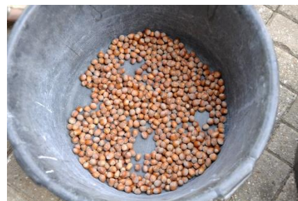
Figuur 23, 24 & 25 Onderaan dit apparaat (afbeelding links) wordt lucht in geblazen, de noten worden er halfweg de verticale pijp ingegoten. De lichte (aangetaste) noten vliegen er langs boven uit (rechtsboven) en de zware (goede) noten vallen er onderaan uit (rechtsonder).

Met een ventilator kunnen slechte noten gescheiden worden van goede noten, al sorteert Harm ook op het zicht de noten met gaatjes eruit.