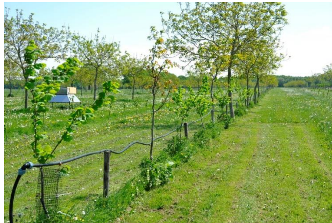
Figuur 42 Ook tussen de bestaande rijen notenbomen werden op een afstand van ongeveer 4 m telkens 2 hazelaars geplant.

Zoals gezegd heeft Roderik de grootste walnotenplantage van Nederland qua oppervlakte, maar niet qua productie. Hun grootste oogst tot nu toe bedroeg 150 kg. Verschillende problemen liggen aan de basis hiervan.