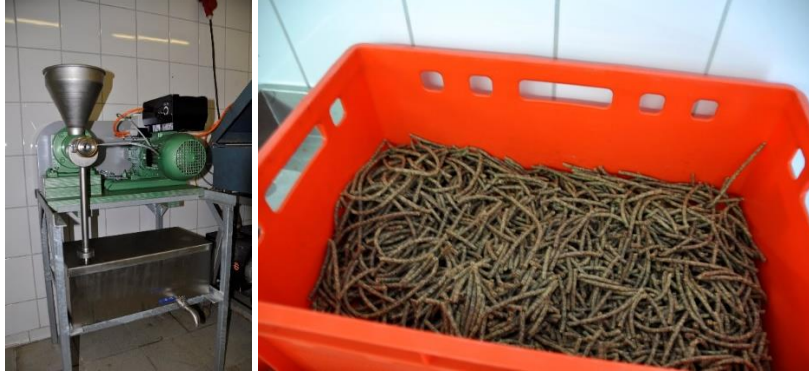
Figuur 45 & 46 Links: Kleinschalige pers voor de productie van olie uit noten en zaden. Rechts: Het restproduct is de perskoek en gaat naar een lokale patissier die deze gebruikt voor de verwerking in taarten en gebak.

Voorlopig gebruiken ze de pers enkel voor het persen van walnoten- en hazelnotenolie. De olie wordt verpakt in flesjes van 200 ml en wordt verkocht aan een prijs van 9,90€.