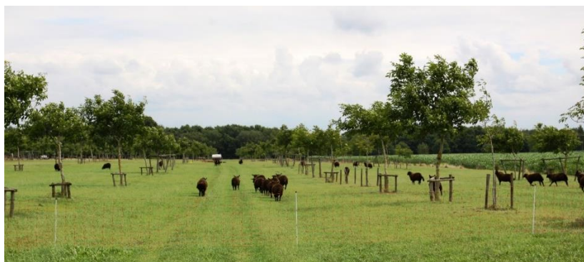
Figuur 39 Op het bedrijf wordt notenteelt gecombineerd met begrazing met Shropshire schapen.

De belangrijkste activiteiten die ze momenteel doen omtrent notenteelt zijn het produceren van noten, het vermeerderen van plantgoed en het maken van promotie van notenteelt. Sinds een viertal jaar zijn ze ook gestart met het persen van notenolie.