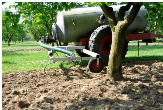
Figuur 18 De rundveedrijfmest van een collega uit de buurt wordt met een kleine beekar op de zwartstroken gebracht en onmiddellijk ondergewerkt met behulp van triltanden.