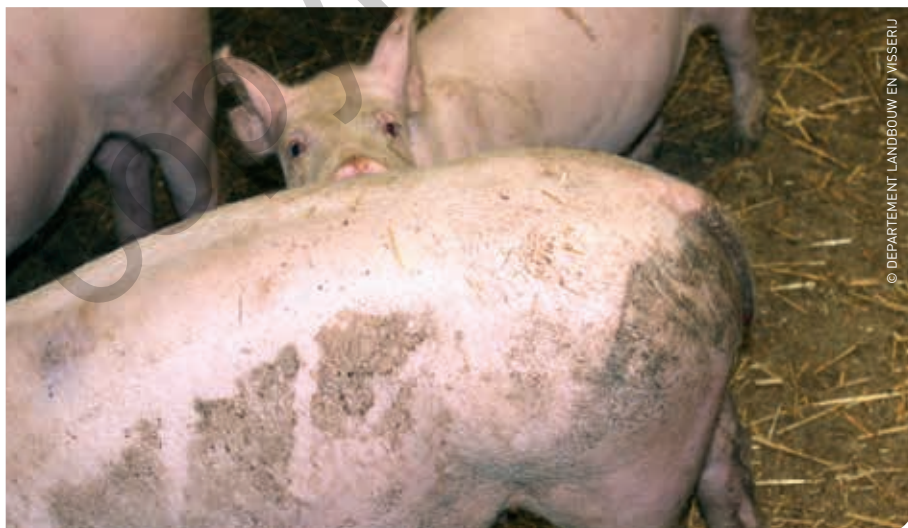
Dit varken vertoont minimale bijtsporen rond de staart.

Meer informatie rond staartbijten en omgevingsverrijking kan je raadplegen via www.varkensloket.be en www.diereninformatie.be .