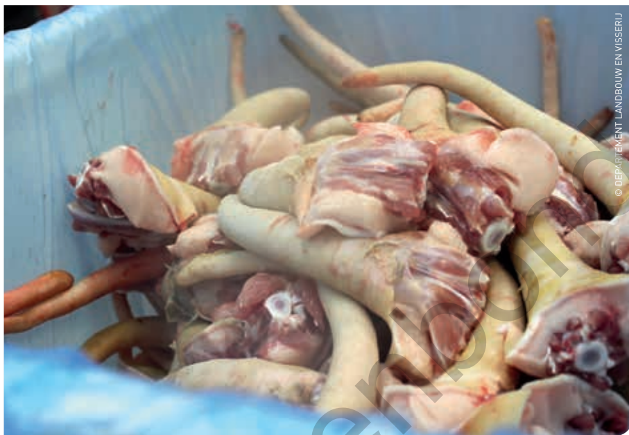
Zweedse vleesvarkens gaan naar het slachthuis met een intacte staart.

Wat de technische resultaten betreft, wordt de Zweedse productie gekenmerkt door een goede levensgroei (groei tussen geboorte en slacht > 660 g/dag) en een lage mortaliteit na het spenen (3 à 4%).