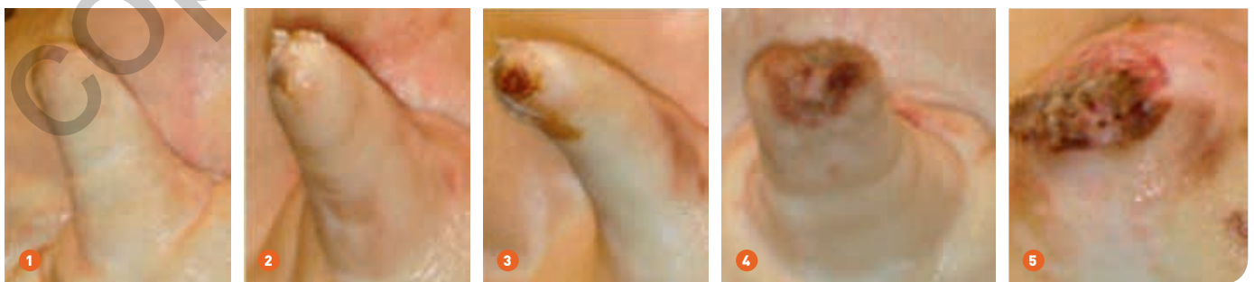
Scorestelsel voor staartletsels. 1 Score 0 = geen tekenen van staartbijten; 2 score 1 = gehele of milde staartletsels; 3 score 2 = tekenen van knabbel- of bijtewonden aan de staart maar zonder zwelling; 4 score 3 = tekenen van knabbel- of bijtewonden aan de staart, met zwelling en mogelijke infectie; 5 score 4 = gedeeltelijk of geheel verlies van de staart. - Bron: Harley et al., 2012 & Caroll et al., 2016

een goede gezondheid, huisvesting en management. Net als in vele EU-landen worden in Ierland praktisch alle (> 99%) staarten gecoupeerd. Toch worden nog geregeld staartletsels aan de slachtlijn waargenomen. Via het scoren van de letsels (zie fotoreeks onderaan) na de ontharingsmachine evalueerde men of er een verband is tussen de ernst van de staartletsels en het karkasgewicht, de productieresultaten en het voorkomen van orgaanafwijkingen. Uit verschillende onderzoeken aan de slachtlijn blijkt dat 58 tot 75% van de Ierse varkens milde staartletsels (score 1) hebben. Gemiddelde staartletselscores (score 2), waar in de praktijk weinig aandacht wordt aan besteed, treffen 7 tot 28% van de varkens. Ernstige staartletsels (score 3 en 4) met een gedeeltelijk of geheel verlies van de staart komen voor bij 0,8 tot 3% van de varkens. Bij beren (in Ierland wordt er niet gecastreerd) worden vaker gemiddelde en ernstige staartletsels aangetroffen dan bij gelten. De ernst van de staartletsels binnen een lot beïnvloedt het koud karkasgewicht, en bijgevolg de uitbetaling aan de varkenshouders. Als het percentage varkens met staartletsels binnen een lot stijgt, daalt