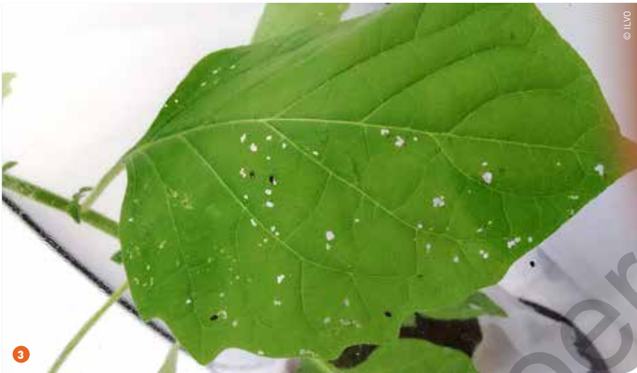
1 Ritnaalden maken gaatjes in de knollen. Binnenin zie je dat ze de aardappel totaal waardeloos maken. 2 Een typisch schadebeeld van epitrix zijn de oppervlakkige groeven op de knol. 3 De volwassen epitrixkevers maken typische kleine gaatjes in de bladeren (hier van zwarte nachtschade). Daarom spreekt men van 'shotgun-symptoom'.

ven en optimalisatie van apparatuur en methodiek. In oktober 2016 werd het project uitgebreid door deelname aan het EraNet-programma, samen met vijf andere Europese landen. Door uitwisseling van expertise tussen de Europese partners zal er een robuuster DSS worden ontwikkeld. ILVO zal in dat Europese C-IPM-project een moleculaire detectietechniek voor ritnaalden ontwikkelen, die kan worden toegepast in het veld.