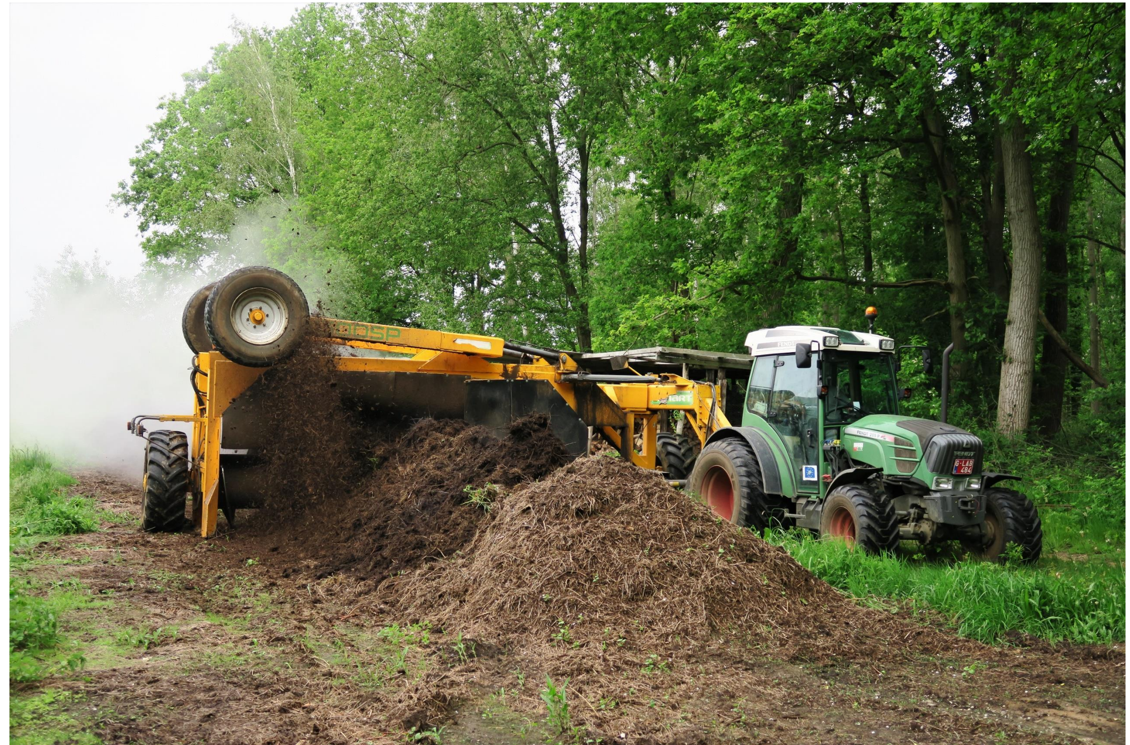
Keren van compost met beheerresten