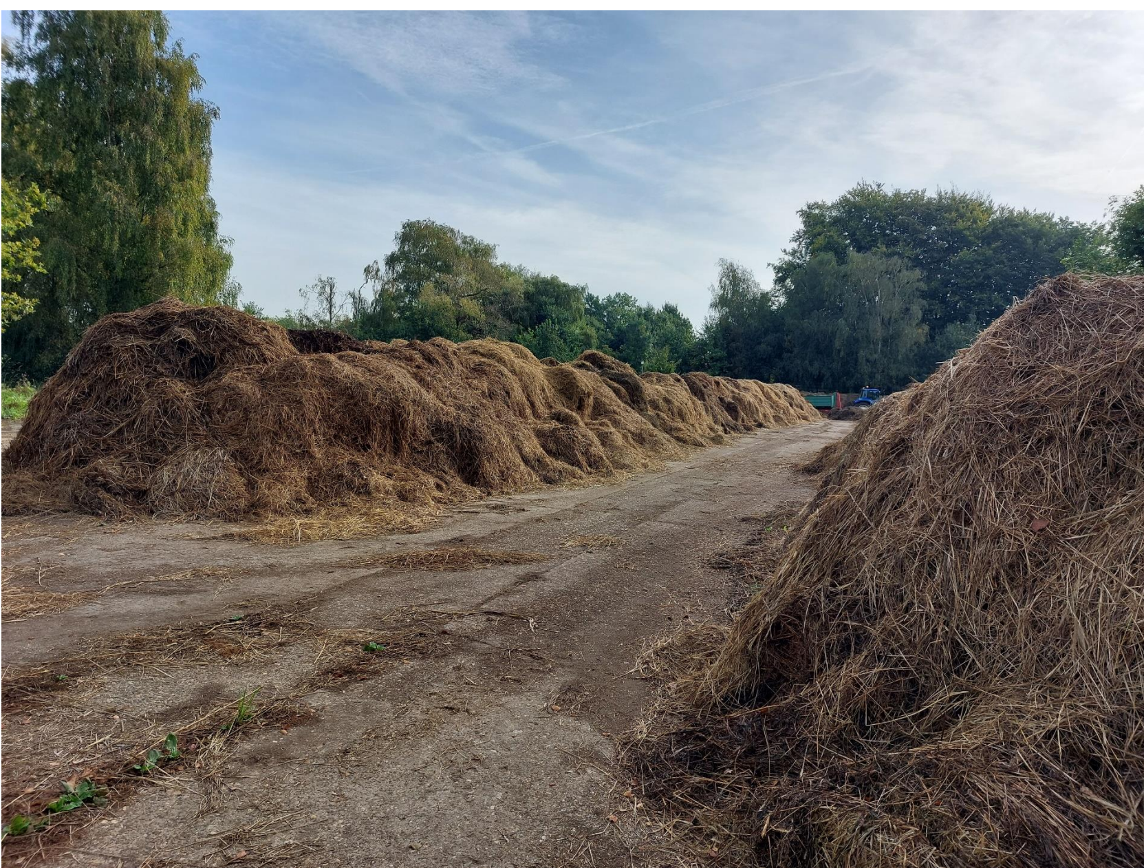
Opslag maaisel Kleine Nete